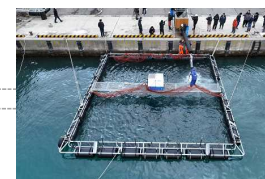
サーモン養殖 (岩館漁港)