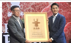
秋田牛トップセールス (タイ)